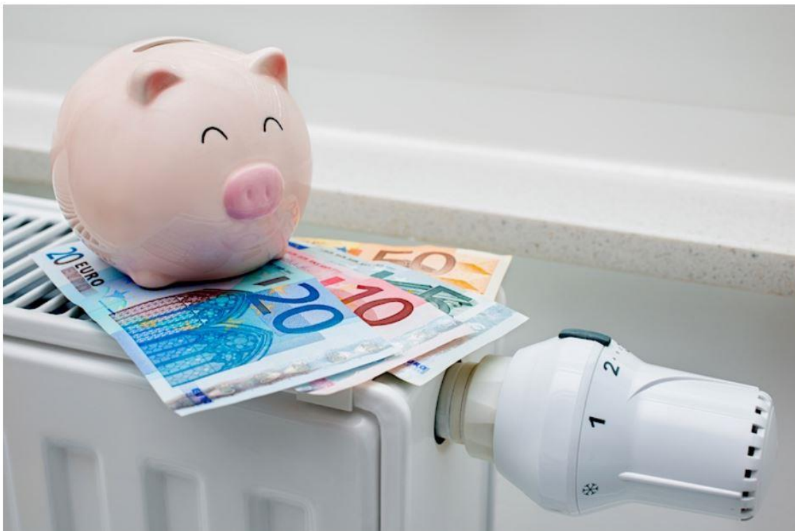
Bild: Wer hätte das vor einem Jahr gedacht? Energiesparen mit der Ölheizung. Aufgrund der zurzeit stark ansteigenden Gas- und Stromkosten ist die Ölheizung auch kostentechnisch eine lukrative Versorgungsalternative.

Zu guter Letzt hat für Besitzer von Ölheizungen schon jetzt die Zukunft begonnen. Denn entgegen der landläufigen Meinung, dass die Ölheizung auf den Friedhof gehört, haben Verbraucher heute schon die Möglichkeit, klassisches Heizöl, E-Fuels und Bio-Heizöl zu mischen und den Anteil an klimaneutraler Energie in den nächsten Jahren kontinuierlich hochzufahren - bis zu einer 100%igen CO 2 -Neutralität. Die Ölbrennwertheizung mit entsprechend modernen doppelwandigen Kunststofftanks wird also auch in Zukunft eine gewichtige Rolle in der Energieversorgung spielen. Weiterführende Informationen zur „Zukunft Ölheizung“ findet man auf www.behaelterverband.de .